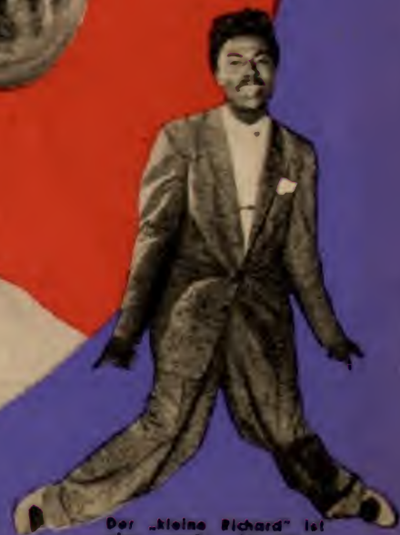
Der „kleine Richard“ ist eine große Attraktion (Seite 54/57)

Was, Sie haben noch immer einen Kater? Ich weiß eine großartige Medizin, um richtig auf Touren zu kommen: DER SCHRÄGE OTTO (Seite 4/5)